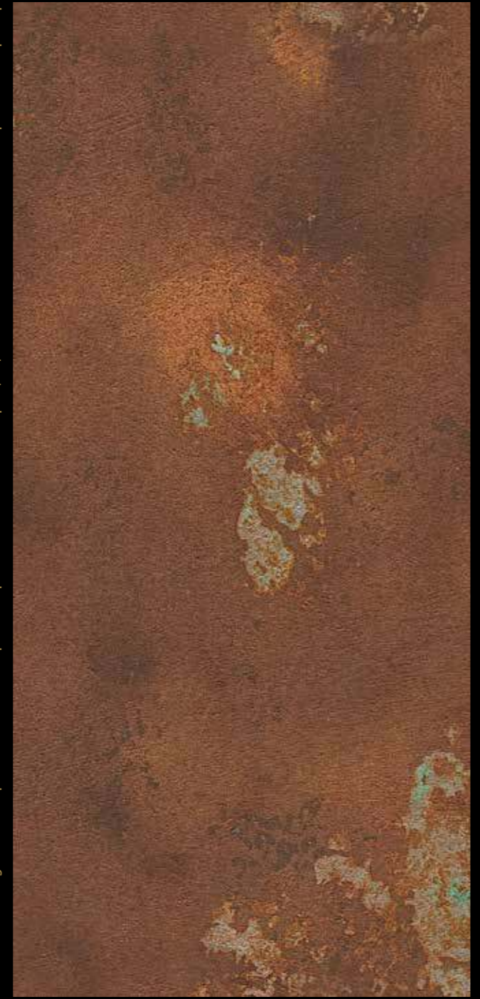
Örnekdöşemenin rengi sadece gösterim amaçlıdır - Uzorak bojeje cisto indikativnog karaktera - 色見本職の色と実物とで、若干色合いが違ふ場合がございます。ご了承ください。