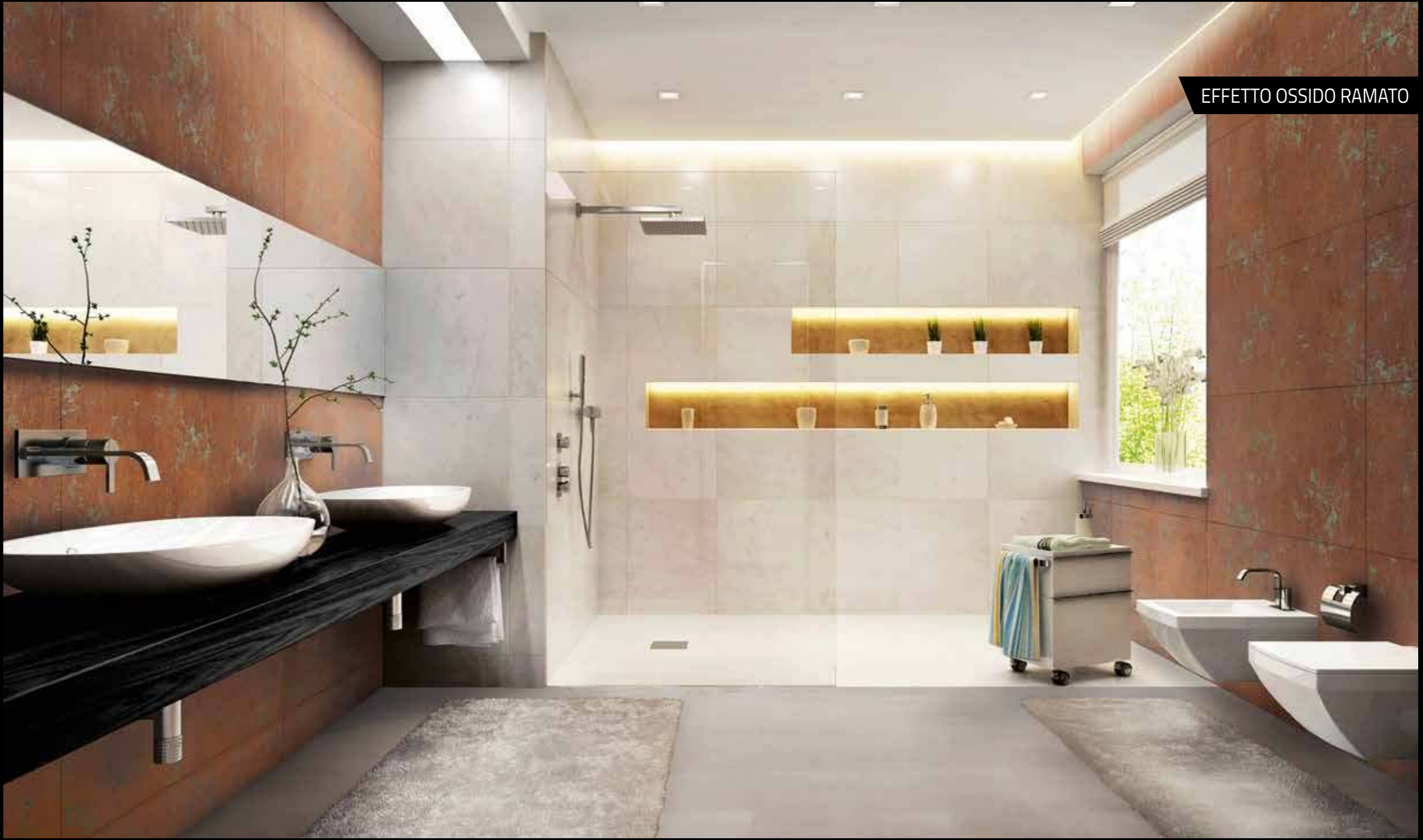
EFFETTO OSSIDO RAMATO